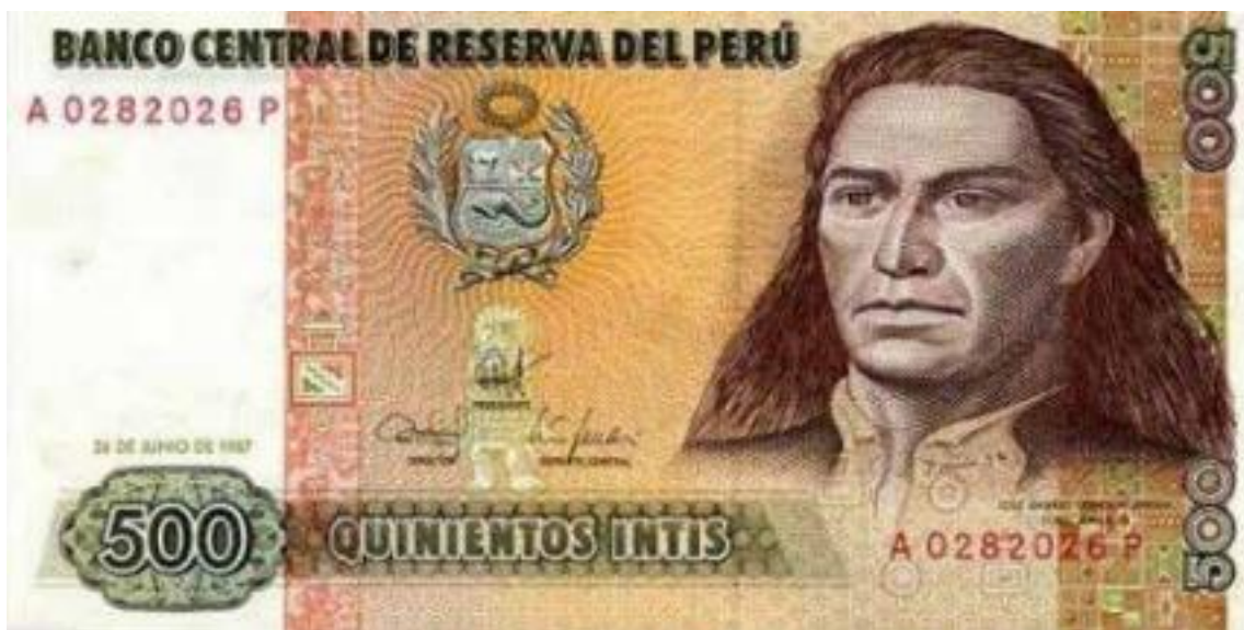
Nota: 500 Intis con el retrato de Túpac Amaru.

A fines de 1990 la situación era insostenible y, nuevamente, para facilitar las transacciones contables un Decreto Supremo publicado el 16 de diciembre de ese año creó el Inti Millón como unidad de cuenta que entró en vigencia el primero de enero de 1991 y que tuvo vigencia hasta el 30 de junio siguiente al ser reemplazado el Inti por el Nuevo Sol.