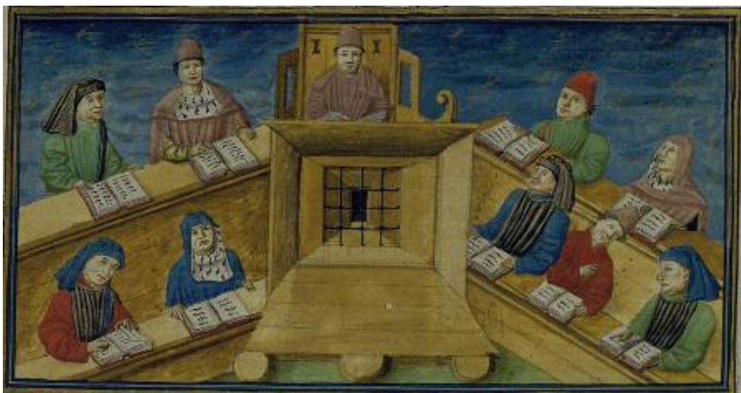
Escena de un aula universitaria. Libro jurídico iluminado. S. XV. Imagen recuperada el 15.08.2022 desde https://bit.ly/3c4lw4B

Hasta aquí estaríamos pensando en un contexto local en el que los individuos comparten la misma lengua, pero cuando hablamos de formación profesional, debemos recordar a las escuelas catedráticas, precursoras de las universidades, en donde ya se prestaba atención a la necesidad de una lengua culta, se promovía el aprendizaje del latín y su uso para la redacción de los primeros libros sobre humanidades, en esta etapa el quehacer intelectual estaba conectado a la vida religiosa, lo cual limitaba la posibilidad de generar nuevos conocimientos en el área de las ciencias, ya que se consideraba prioridad el análisis de las sagradas escrituras, pero el sistema de organización que lograron da inicio a la estructura universitaria y a una nueva visión orientada a la idea de que el saber es universal y para recordarlo solo hace falta buscar el significado de la palabra universidad en el diccionario de la Real Academia Española donde se indica que universidad deriva etimológicamente del latín universitas , -ātis 'universalidad, totalidad', 'colectividad', 'gremio, corporación' y en latín medieval ya hacía referencia a institución de enseñanza superior.