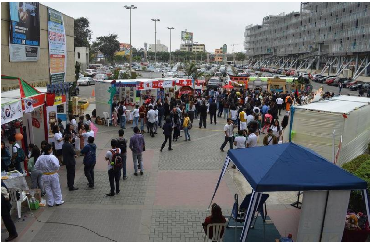
Feria de Negocios Globales organizada anualmente por el Programa de Idiomas de la Escuela Profesional e Negocios Globales de la Facultad de Ciencias Económicas y Empresariales de la Universidad Ricardo Palma, donde los alumnos del Programa de Idiomas demuestran sus logros comunicándose exclusivamente en las lenguas que aprenden durante el año.

Las universidades más importantes del mundo también ofrecen cursos intensivos de idiomas que permiten al estudiante visitante practicar el idioma que está aprendiendo en el contexto real durante su estancia, estas ofertas en su mayoría incluyen actividades culturales que ayudan también a entender la forma de pensar de los hablantes nativos, experiencias que hoy en día son consideradas las fortalezas del mundo globalizado en el que los vínculos académicos, culturales y profesionales se valoran cada día más, ahora que muchas de las empresas se han convertido en multinacionales.