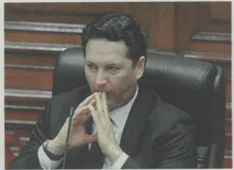
Presentó imágenes del 2013 como si fueran del 2017 en informe.

♦ En una accidentada sesión, en donde –al inicio– la representación de Perú Libre se abstuvo de votar a favor o en contra, junto a algunos congresistas de Acción Popular, Salaverry se libró de la acusación, sobre todo por el impedimento de voto de los 32 miembros de la Comisión Permanente. Luego del pedido de reconsideración, y tras un exhorto a evitar malos precedentes en el trabajo legislativo, finalmente fue denunciado.